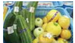
↑ズッキーニもいろいろ!