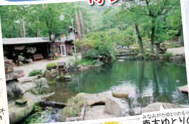
みなみがたゆとりのもり 南方ゆとりの森

郵便 大きな森には ジャブジャブ入って遊べる小 川もあるし、涼しい木陰に木 のぶらんともあるよ。お風は おマンには鉄板でお好み焼 きも焼いてもらおうね。みん なで一緒に作ったら楽しいよ。