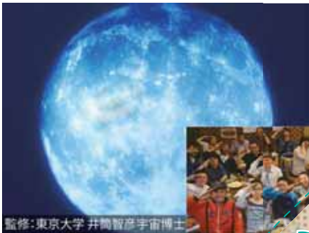
監修:東京大学 井筒智彦宇宙博士

〒北広島町川戸2809-3 せんごくの里 ☎0826-72-7855 7月20日(日)・26日(土) 7:30~12:00 雨天決行 1本100円(スタッフが収穫したものは1本150円) ※イベントの詳細、スイートコーンの販売はHPで確認