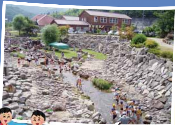
そなたにがわかせんこうえん 添谷川河川公園