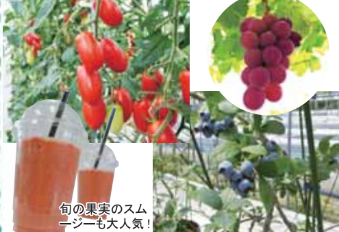
旬の果実のスムージーも大人気!

〒北広島町阿坂4827-1 ☎080-1633-2785 要HP確認 10:00~16:00 ブルーベリー:40分食べ放題 中学生以上1,200円、トマト:40分食べ放題 中学生以上700円 ※持ち帰りは別料金