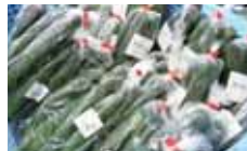
↑産直市に並んだきゅうり

※塩漬けや塩出しの手間もいらず、少量の調味料ででき るので、塩分のとり過ぎをさけることができます。