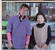
〔上〕豆腐ステーキ(450円)も看板メニューだ