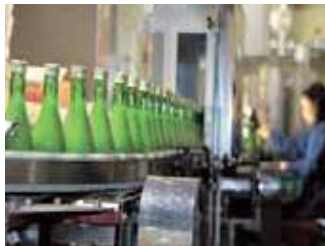
↑次々と瓶詰されていくにがり酒。