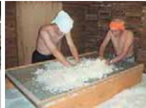
↑麹づくり：酒造りの中で最も重要な工程。