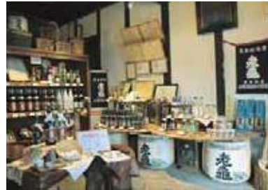
→お酒を求めに直接蔵元を訪ねてみるのも趣がある。