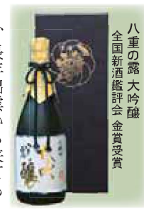
八重の露大吟醸 全国新酒鑑評会 金賞受賞