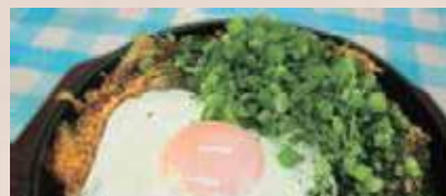
そば肉玉 580円 ※目玉焼き、ネギは店内客へのサービス