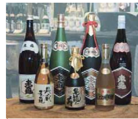
↑小野酒造製品のラインナップ

社長は十五代目。伝統の味を伝えながら、時代が必要とする酒造りにもチャレンジしている。杜氏を務めることで自分の味をダイレクトに表現している。特に冬場の仕込み時期には、まさに寝食を忘れて酒造りに没頭する。杜氏として北広島の達人にも認定された。