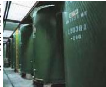
↑樽の中で熟成の時を待つ。

れている。 出荷は主に近隣市町で、町内でも多くの飲食店が提供している。 「酒は生きもので微妙な世界。それでも味を守り続けることに徹している。」という酒造りの姿勢が今の時代にも変わ