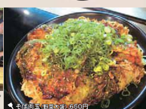
そば肉玉(野菜大盛) 650円 ※ネギは店内客へのサービス