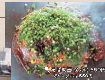
そば肉玉(ダブル) 650円 ※シングルは550円