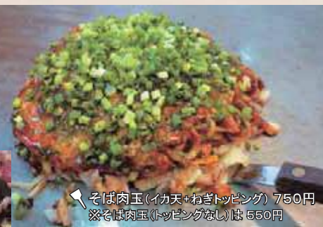
そば肉玉(イカ天・ねぎトッピング) 750円 ※そば肉玉(トッピングなし)は 550円