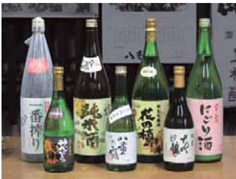
↑上杉酒造製品のラインナップ

く、長年出雲から来てもらっているとのこと。酒米はすべて広島県産で賄われている。 酒造りに適した軟水の井戸水に恵まれ、しっかりとした味わいがあり、それでいてすっきりとした飲み口が特徴といえる。 近年、味の濃い料理が好まれるようになり、日本酒もさっぱりした辛口が好まれ、「八重の露」は多くの日本酒党に支持さ