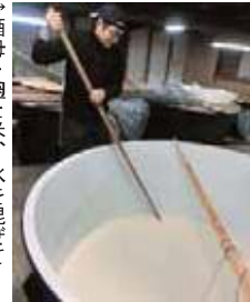
→酒母・麹と米、水を混ぜて発酵させる。