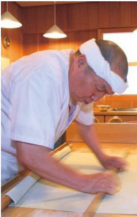
高橋名人とそば打ちが一体となり、不思議な緊張感に包まれる瞬間

2008年7月、洞爺湖サミットにそば打ち名人として招請された。それは、日本人として認められた証でもある。