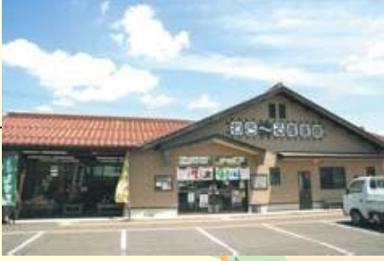
大朝 わさ〜る産直館