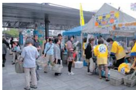
北広島キャンペーン開催中。広島駅南口広場でキャラバン隊が活躍中。