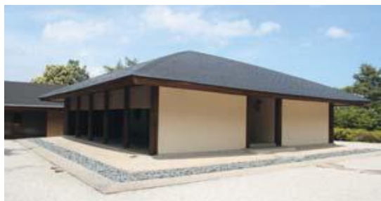
店内外はどことなく修験道場のような雰囲気、で凛とした空気感を醸し出している。