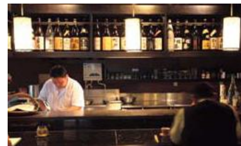
↑解禁日にとれたての島根県八戸川の鮎 ←店主厳選の銘酒が並びカウンター席