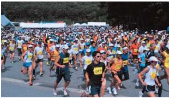
問 北広島町観光協会芸北支部 ☎0826・35・0888

●会場／やわたハイランド 191リゾート(マップA) ● 午前10時30分競技スタート