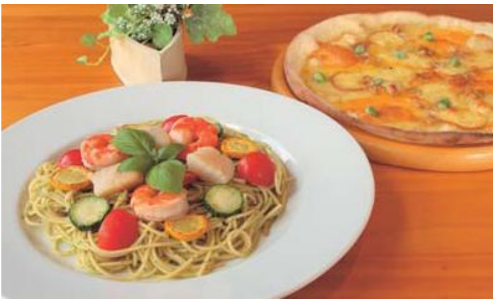
(右)いろいろなチーズとクルミのピザ 1450円 (左)エビとホタテのスパゲティ バジル風味 1250円

それだけに食材にも愛着を持ち、完全予約制で、食べる人に合わせて必要なだけを用意し、調理する。山本さんは「こうして8年目を迎えられるのも皆さんのおかげ」と、人との出会いや繋がりが、そして食材との出会いにも感謝を込めて、ひとつひとつ丁寧に調理されている。 料理をおいしくいただくために、お酒も全国から取寄せられ、部屋も庭も贅沢に仕上がっている。そんなこだわりと様々な心配りが何よりお料理を引き立てている。