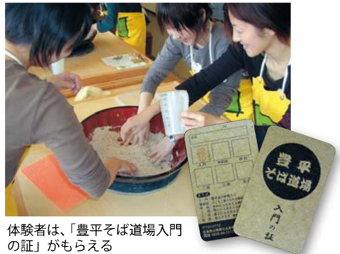
体験者は、「豊平そば道場入門の証」がもらえる